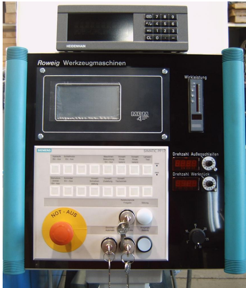
Bedienung mit X-Achsenanzeige und Auswuchten